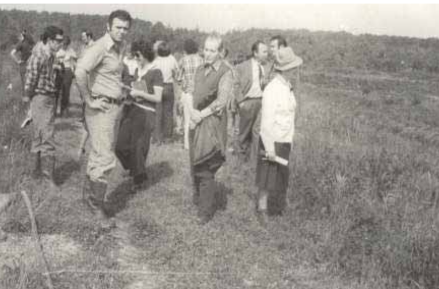
Slika 23 Akademik Slavko Matić na terenu kod Lipovljana 1975. godine

Bio je veliki zagovornik prirodnog uzgajanja šuma i promicatelj zagrebačke škole uzgajanja šuma. Afirmirao je u hrvatskom šumarstvu opredjeljenje za prirodno pomlađivanje i prirodnu strukturu sastojine te prirodne, raznolike i stabilne šume.