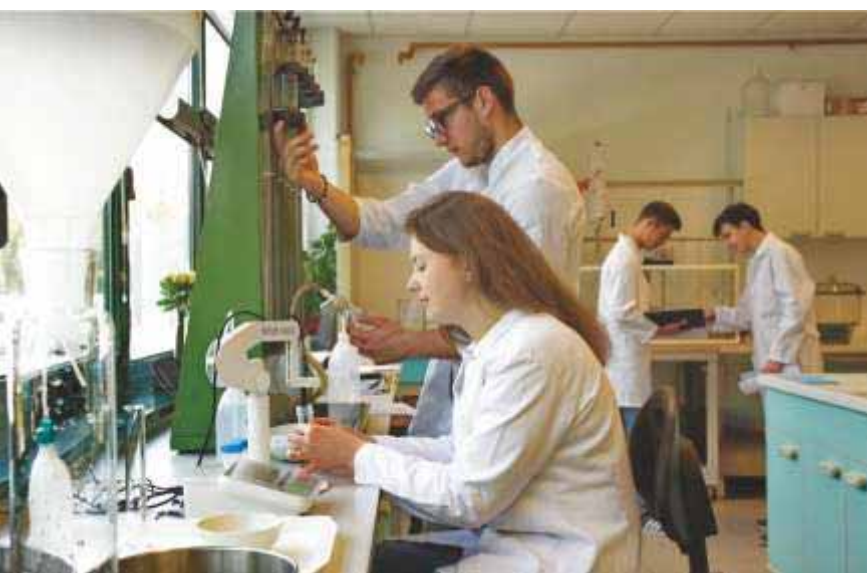
Slika 82 Studenti u Ekološko-pedološkom laboratoriju tijekom svojih laboratorijskih vježbi 2019. godine

Što se tiče znanstvenih aktivnosti, u Ekološko-pedološkom laboratoriju ponajprije se provode istraživanja s područja tloznanstva – ispituju se fizička i kemijska svojstva tala. Tako se obavljaju analize granulometrijskog sastava tla, vodopropusnosti, kiselosti tla, određivanja sadržaja karbonata, ukupnog ugljika i dušika, metala i metaloida u uzorcima tla.