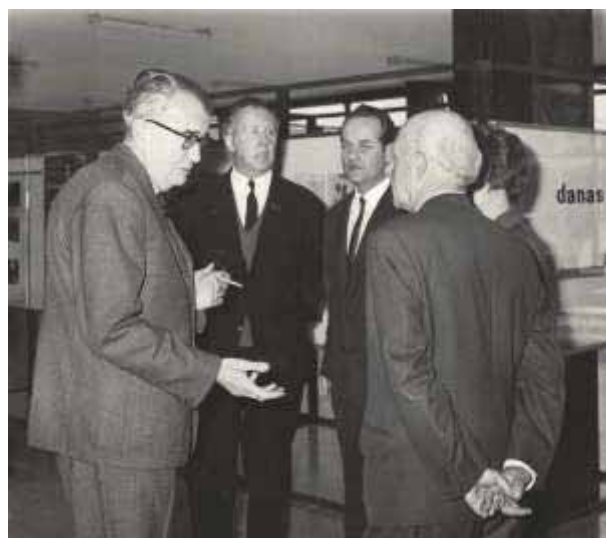
Slika 38 Prof. dr. sc. Stjepan Bertović (u sredini) na proslavi 20 godina Instituta za šumarska istraživanja 1966. god.

Potaknuo je i započeo izdavati glasilo Šumarskog instituta Radovi (1966.), čiji je bio prvi i glavni urednik.