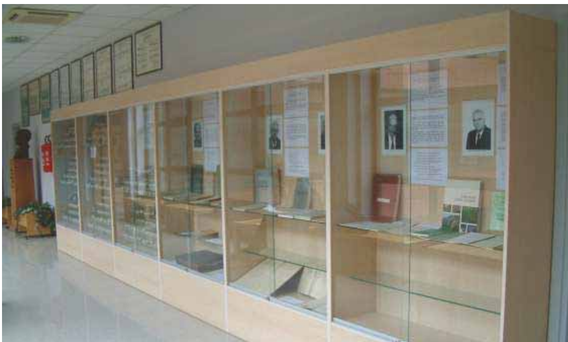
Slika 81 Poprsje akademika Milana Anića i vitrine u hodniku Zavoda posvećene najznamenitijim stručnjacima u povijesti Zavoda i zagrebačke škole uzgajanja šuma