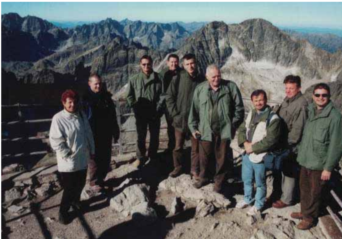
Slika 77 Na 2632 m n.m. u Visokim Tatrama (Lomnický štít), Slovačka 2000. godine