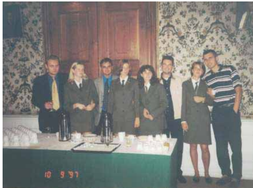
Slika 76 Domaćice međunarodnog znanstvenog skupa i asistenti šumarskog fakulteta u Banskjoj Štiavnici 1997. godine