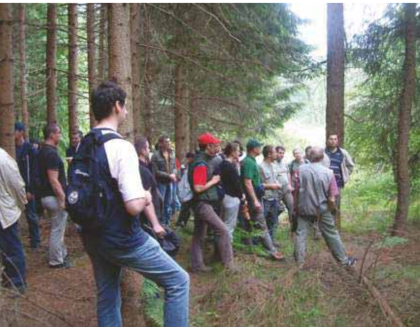
Slika 25 Prof. dr. sc. Milan Oršanić vodi terensku nastavu iz Osnivanja šuma u Bosiljevu 2007. godine

Savjeta Sveučilišta u Zagrebu (2015. – 2018.). Predsjednik je Upravnog vijeća Hrvatskoga šumarskog instituta od 2018. godine. Bio je član Upravnog vijeća Hrvatskoga geološkog instituta (2009. – 2012.) i Odbora za proračun Sveučilišta u Zagrebu (2014. – 2018.). Član je Nacionalnog vijeća za znanost, obrazovanje i tehnološki razvoj Republike Hrvatske od 2021. godine. Član je uredništva znanstvenih časopisa Šumarski list, Croatian journal of forest engineering i Glasnik za šumske pokuse. Dobitnik je posebne nagrade Rektora Sveučilišta u Zagrebu za rad u sveučilišnim tijelima i Velike medalje Mendelova sveučilišta u Brnu. Godine 2015. Šumarski fakultet Sveučilišta u Zagrebu dodijelio mu je priznanje za uvođenje sustava kvalitete.