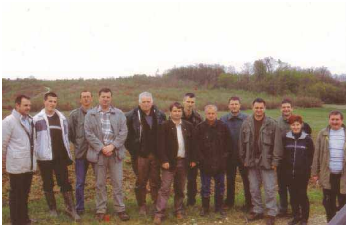
Slika 61 Zajednička terenska nastava na području Šumarije Križevci 2002. godine