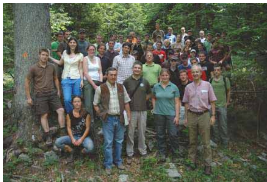
Slika 72 Studenti i profesori šumarskog odjela Sveučilišta BOKU iz Beča na terenskoj nastavi na području Šumarije Ravna gora 2010. godine

i Kanade. Puno je međunarodnih i domaćih znanstvenih skupova u čijoj je organizaciji neposredno sudjelovao netko od članova Zavoda, kao predsjednik ili član organizacijskog ili znanstvenog odbora. Zavod je vodio organizaciju najvećeg međunarodnog skupa održanog na Šumarskom fakultetu u Zagrebu, svjetskog kongresa o uzgajanju hrastovih šuma i genetici hrastova (IUFRO International scientific conference OAK – 2000: Improvement of wood quality and genetic diversity of oaks, Zagreb, 20. – 25. 5. 2000.).