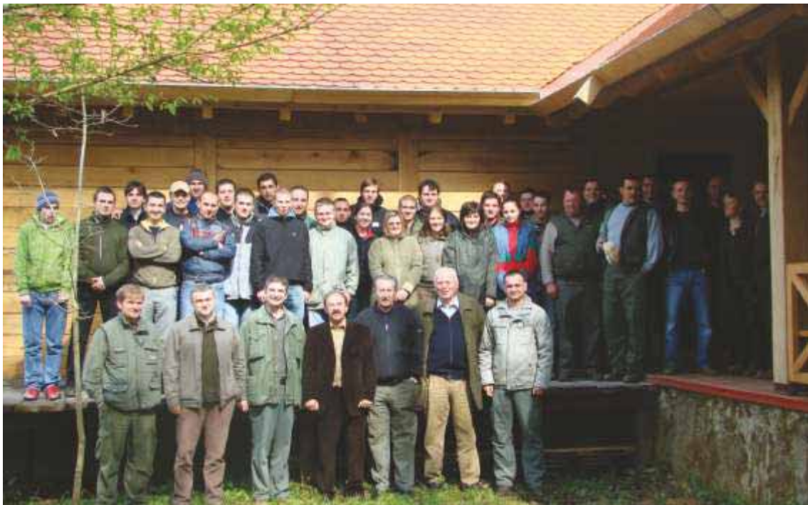
Slika 63 S domaćinima iz Uprave šuma Sisak i Šumarije Lekenik na tradicionalnoj terenskoj nastavi iz Ekologije šuma, Šumarske fitocenologije i Uzgajanja šuma u šumi Kalje 2008. godine