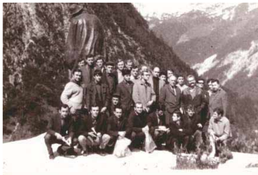
Slika 57 Posljednja fotografija akademika Milana Anića sa studentima snimljena na terenskoj nastavi u Sloveniji 1968. godine

bilateralnih ugovora o suradnji između Šumarskoga fakulteta Sveučilišta u Zagrebu i Mendelova poljoprivredno-šumarskog sveučilišta u Brnu. Već petnaest generacija studenata boravilo je na višednevnoj terenskoj ekskurziji u Češkoj, iz kolegija Uzgajanje šuma II i Silvikultura.