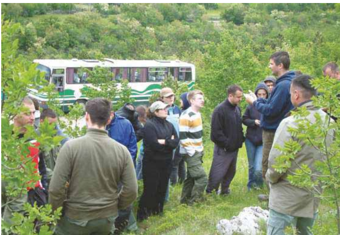
Slika 62 Terenska nastava iz Uzgajanja šuma u Senjskoj dragi 2006. godine