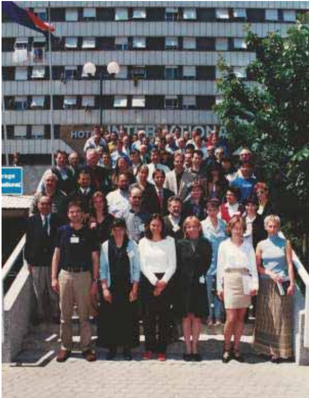
Slika 73 Sudionici IUFRO kongresa o uzgajanju hrastovih šuma i genetici hrastova (OAK 2000)