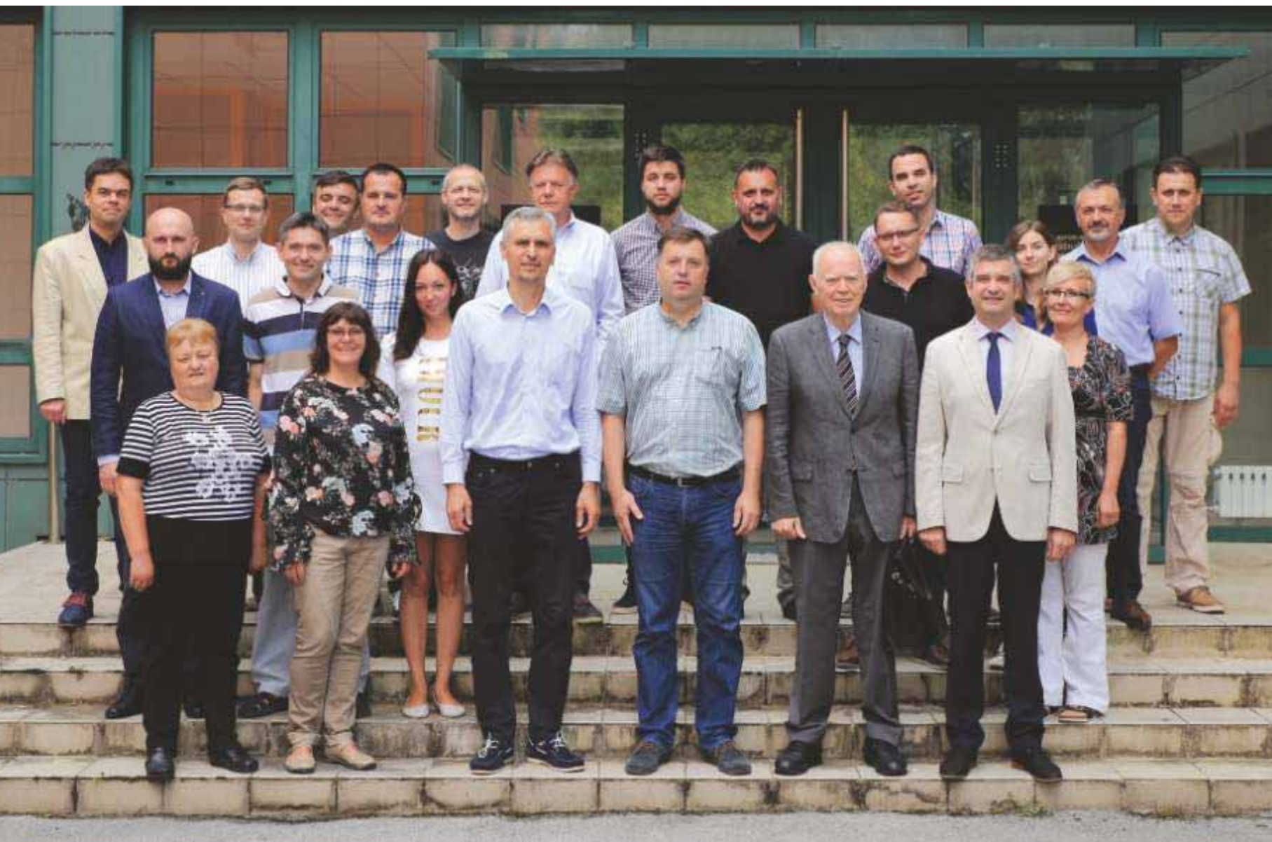
Slika 15 Zajednička fotografija članova Zavoda 2018. godine