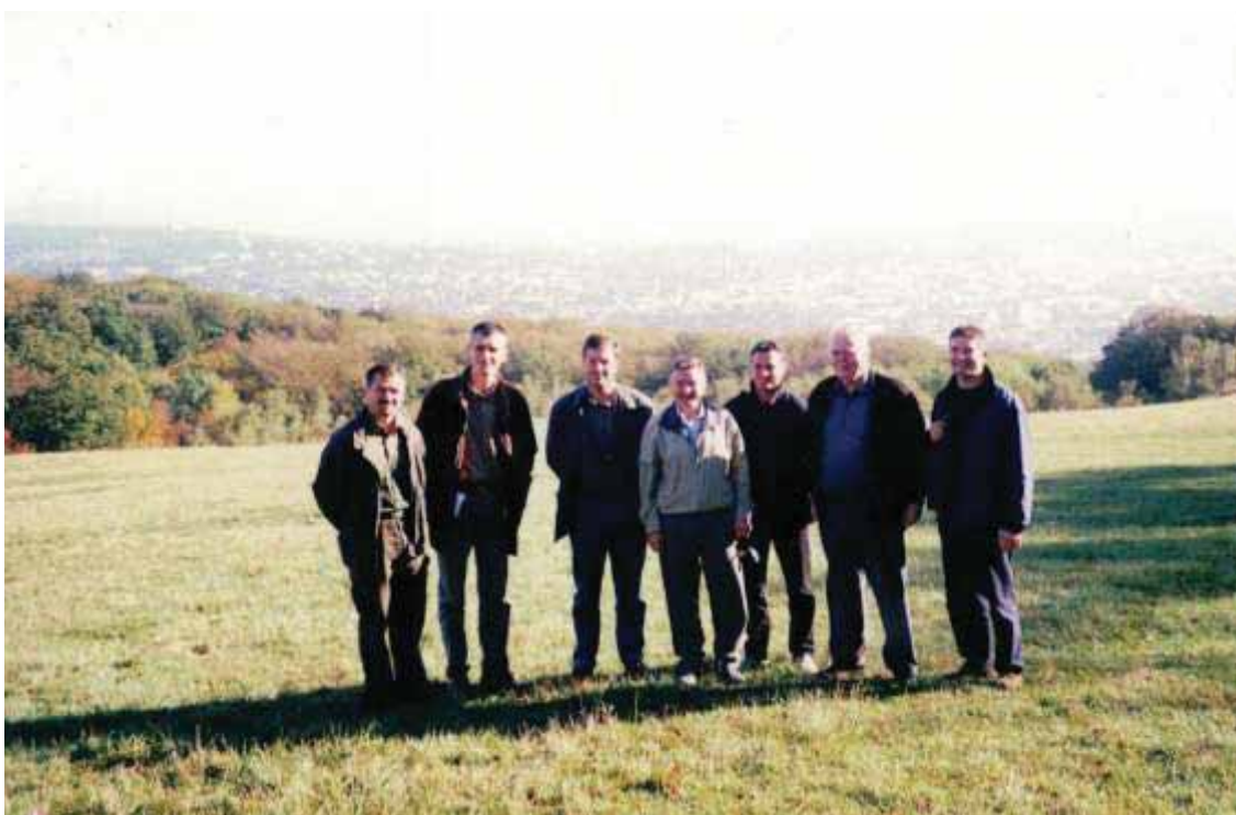
Slika 78 Na stručnoj ekskurziji u Bečkoj šumi (Wienerwald) u Austriji