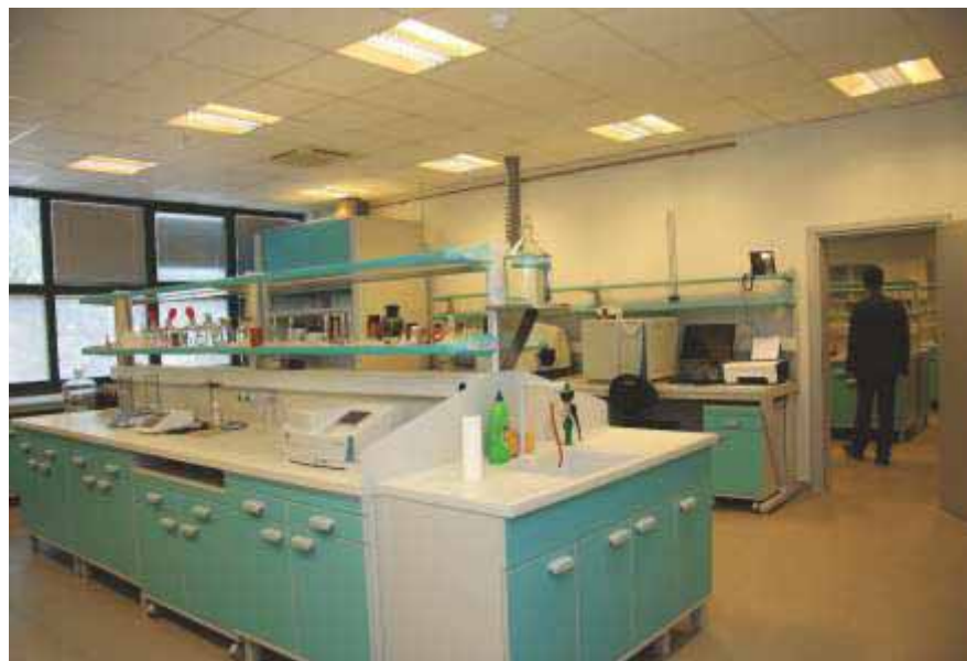
Slika 83 Moderno uređen i opremljen Ekološko-pedološki laboratorij