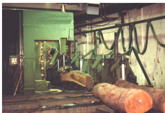
Slika 14. Raspiljivanje trupaca divlje trešnje na tračnoj pili trupčari