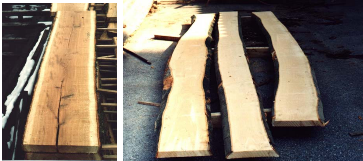
Tablica 1. Dimenzije i volumen piljenica