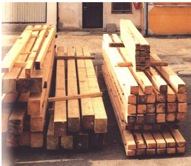
Tablica 4. Dimenzije i volumen greda, gredica i letvi za mjerenje