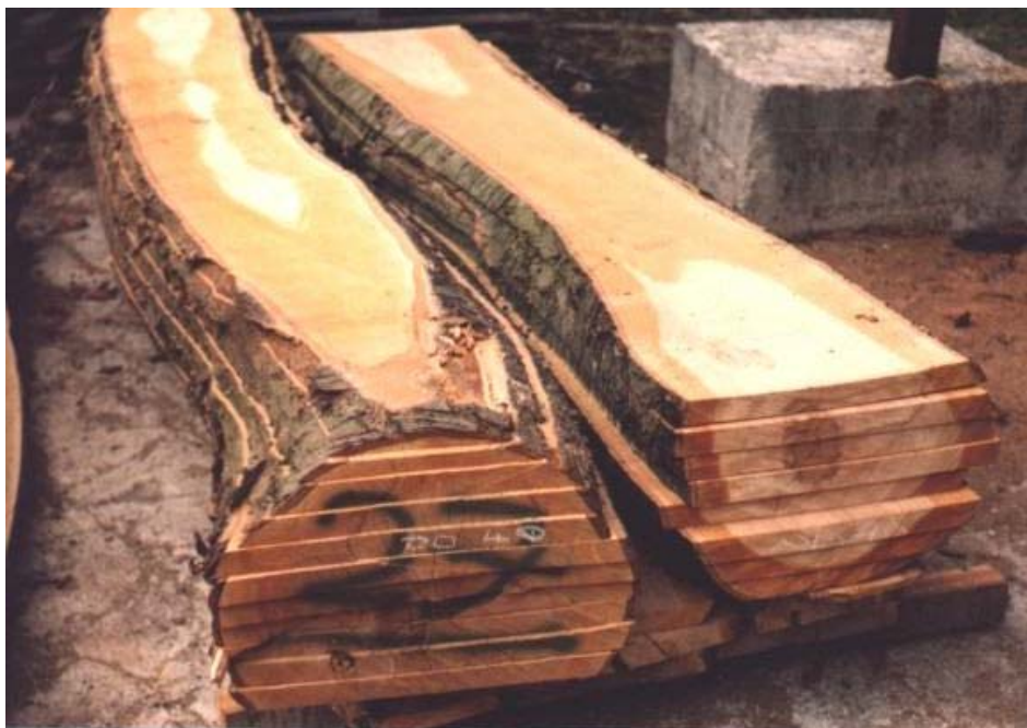
Tablica 2. Dimenzije i volumen kladarki